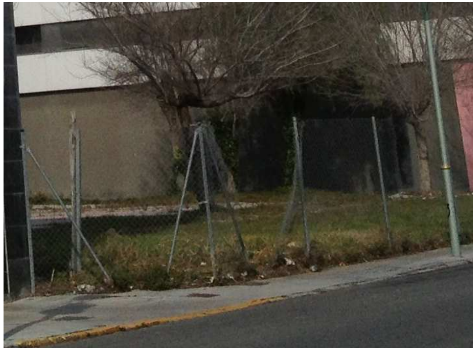
Tanca metàl·lica deteriorada

Donat que l'actual tancament de la Plaça 1 de Maig de Torreforta és una tanca metàl·lica de simple torsió, que està deteriorada, que envaeix la zona de la vorera i que transmet una imatge d'abandonament i precarietat, fa que sigui necessari una actuació per tal d'evitar-ho.