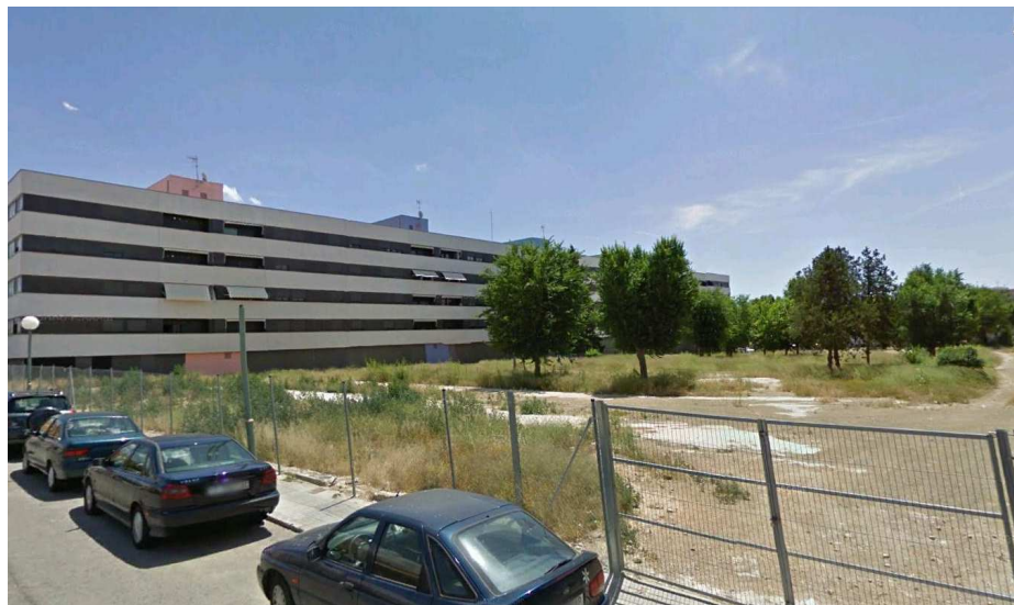
Tanca actual C/ de l'Ebre

La nova tanca serà aprofitada de l'edifici de la Tabacalera i que és de ferro, optimitzant per tant en quant a material i ma d'obra, a més de reciclar el material existent i fent sostenible l'actuació.