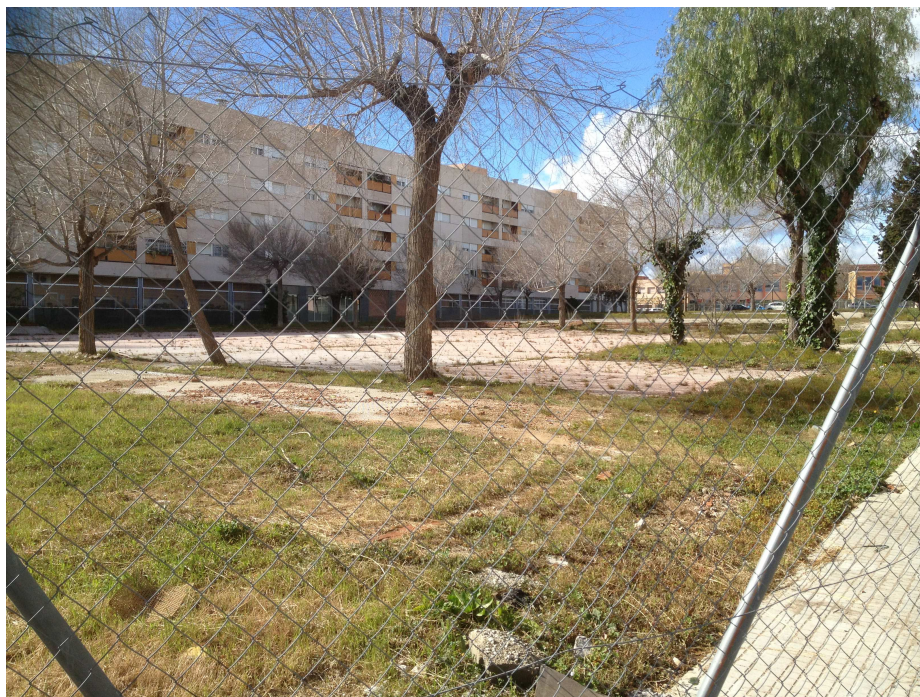
Vista de l'interior