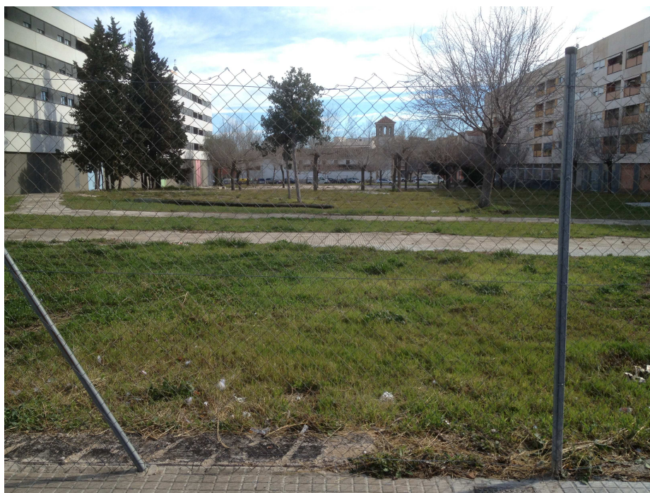
Vista de l'interior