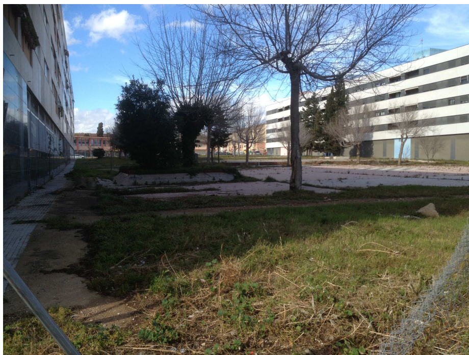
Aspecte actual de l'interior

La resta es deixarà com a zona enjardinada.