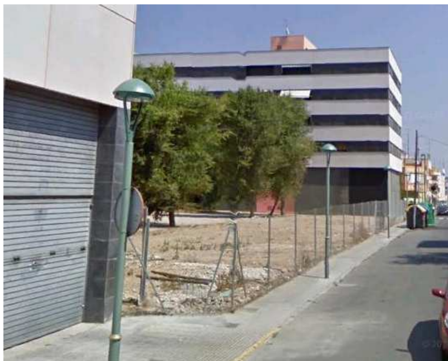
Tanca actual C/ Segarra