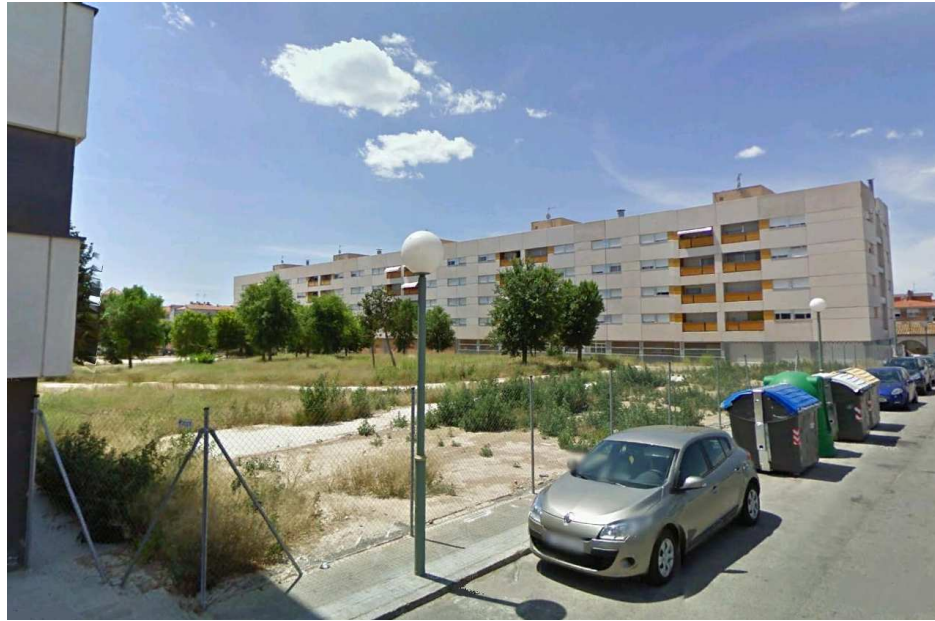
Tanca actual C/ de l'Ebre